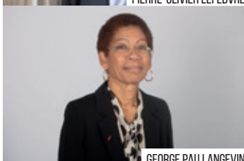
GEORGE PAU LANGEVIN